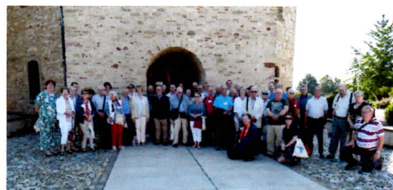
A Ottmarsheim (RIO 2018)