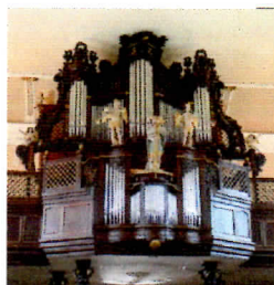
Redersdorf (RIO 2018)