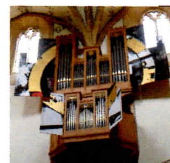
Les 2 orgues de la Stadtkirche de Bière (Suisse - RIO 2018)