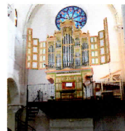
Grandvillars (RIO 2018)