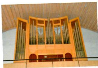
Orgue de Dombresson